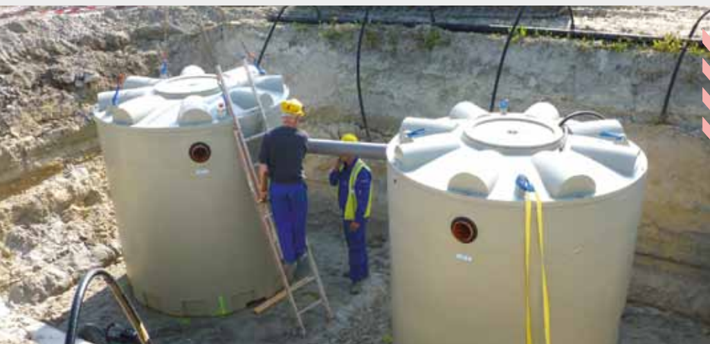
▲ Mise en œuvre d'une microstation type M (42 EH) de chez NDG eau

PRODUITS COMPLÉMENTAIRES : stations de relevage, dégrilleur, débourbeur, bac dégraisseur, pompage, épandage, puits d'infiltration, entretiens, tranchée drainante.