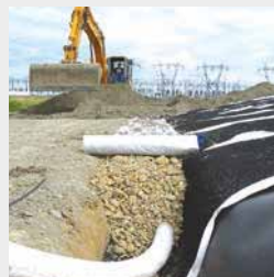
1. Création de plateforme et merlons 2. Création de plateforme cailloux 3. Gabions 4. Tranchées drainante et géotextile