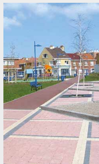
1. Dalles engazonnées 2. Aménagement de parc : pavages